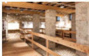
Il Museo Archeologico dei Sette Comuni a Rotzo ospita un'installazione di "realtà aumentata"